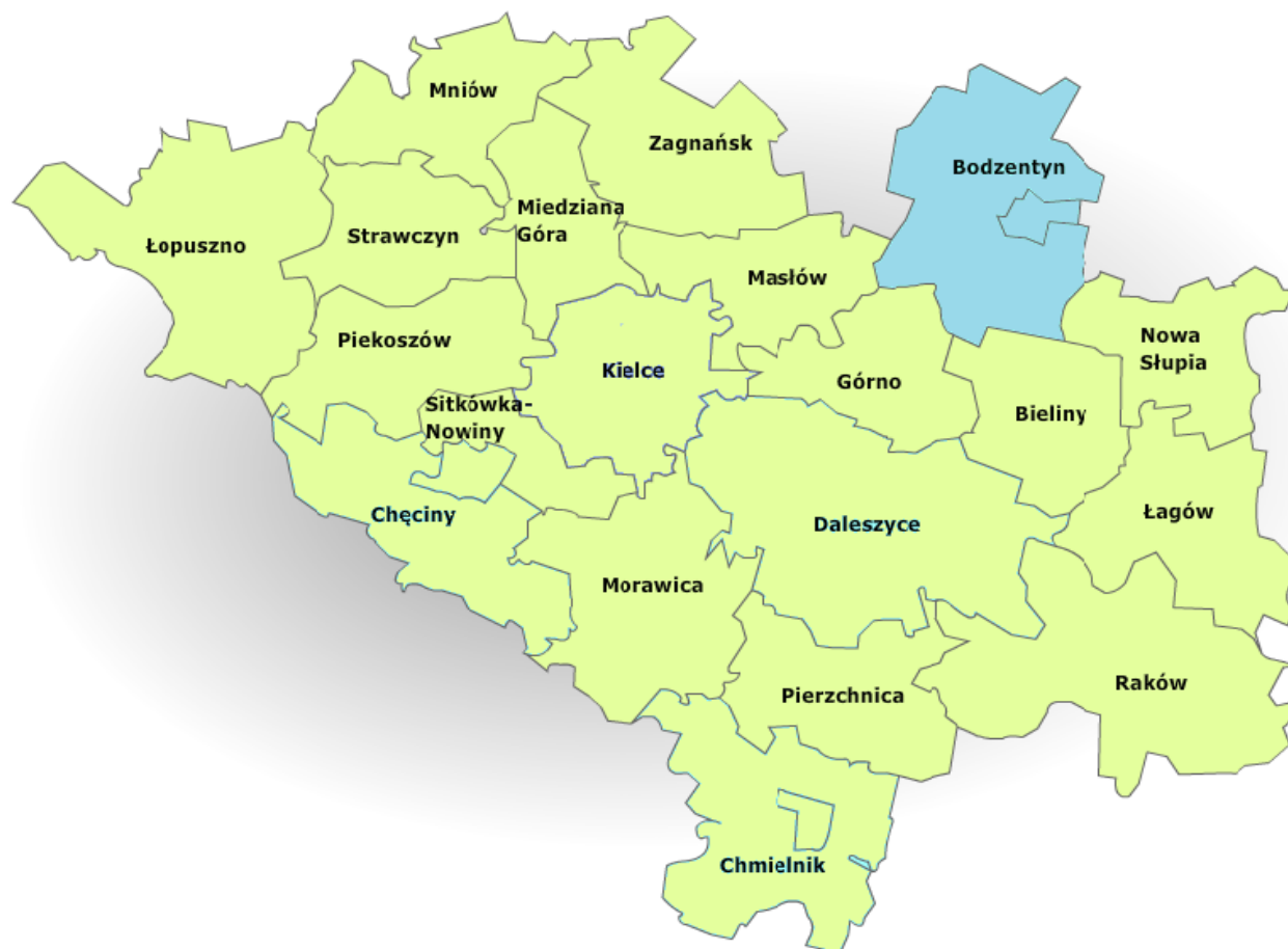
Rysunek 1. Położenie gminy.