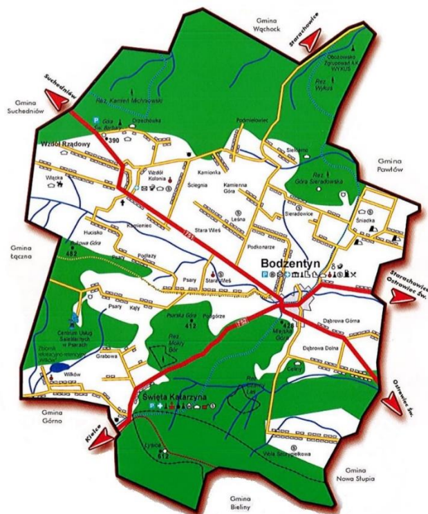
Mapa 1. Przebieg granic Gminy Bodzentyn, dróg dojazdowych oraz rozmieszczenia atrakcji.

Ogólna powierzchnia gminy wynosi 16,032 ha, w tym miasta 865 ha. W skład jednostki wchodzi 1 miasto i 23 sołectwa, wśród których największymi są: Celiny, Leśna, Psary Stara Wieś, Sieradowice, Śniadka, Święta Katarzyna, Wiącka, Wilków, Wola Szczygielkowa i Wzdół Rządowy. W gminie mieszka ok. 11573 mieszkańców, w tym w mieście ok. 2209.